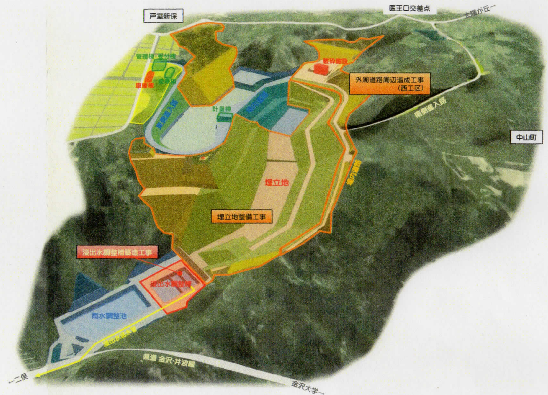
【工事スケジュール】